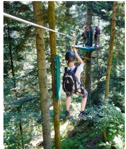
Neues ausprobieren (Zipline)